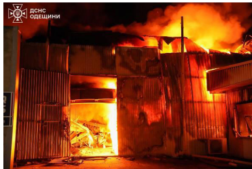
Фото з Telegram-каналу: Новости Одесса | Одеса

Посилання: https://t.me/our_odessa/66319