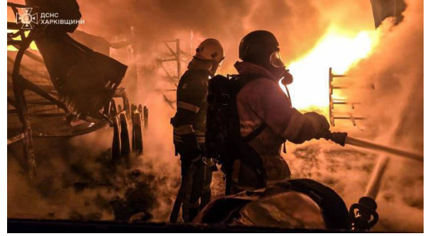
Фото з Telegram-каналу: Харьков Life | Харків Посилання: https://t.me/kharkivlife/83238

По селу Черкаські Тишки Харківського району окупанти завдали ударів КАБами. Постраждала 74-річна жінка.