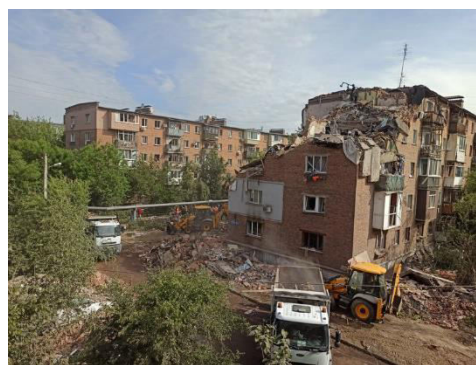
Фото з офіційного сайту Міністерства внутрішніх справ України Посилання: http://surl.li/ueijm ; http://surl.li/ueimt